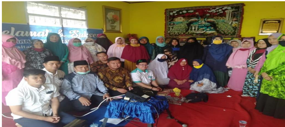
Gambar 1. Foto Kegiatan PKM di Desa Bandar Rahmat Kabupaten Batubara

Kendala- kendala yang dihadapi dalam pelaksanaan pengabdian masyarakat ini adalah masalah waktu pelaksanaan yang sangat terbatas sehingga permasalahan yang dihadapi belum tersampaikan secara jelas.